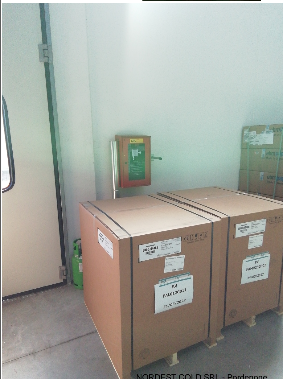
NORDEST COLD SRL - Pordenone