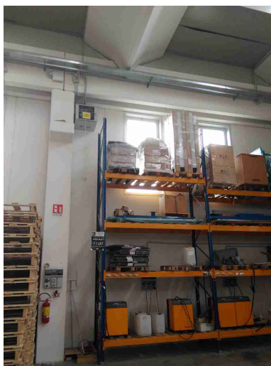
VITRIFRIGO SRL - VF1

Garantire ricambio aria durante la ricarica delle batterie